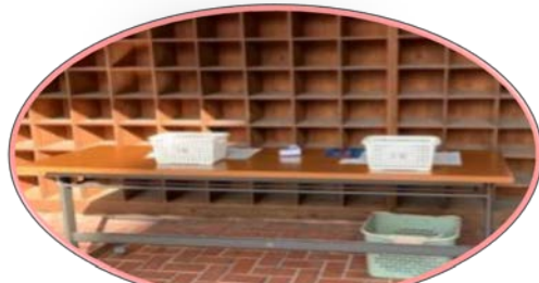
昇降口での健康観察回収