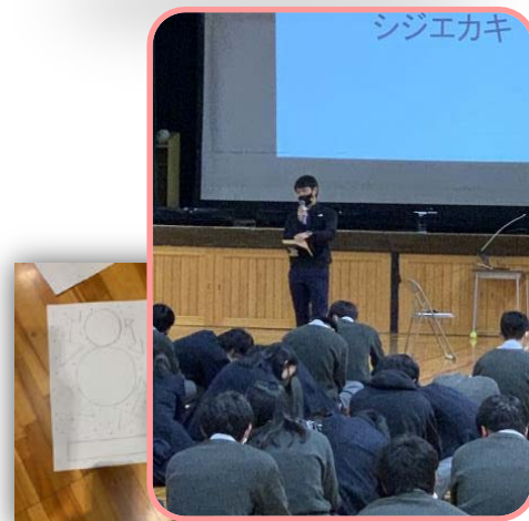
デートDV出前授業風景

アルコールの量 少ないと意味がありません！ 1回しっかり下まで プッシュして出用量 を使います。