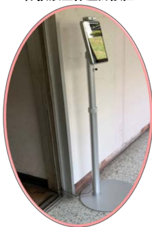
非接触型体温計設置

健康観察の昇降口回収 部活動停止 始業式のリモート開催 午前中授業 短縮授業 リモート授業 「黙食」