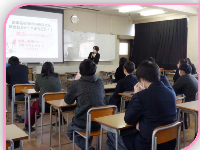
献血講話授業風景

期末考査 3年献血講話 学校保健委員会 防災訓練 1.2年共同演劇鑑賞 3年1日旅行(USJ) 穴窯焼成 全校一斉漢字テスト 大掃除 終業式は全員体育館で・・・。 冬休み