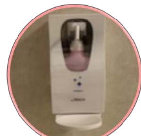
各教室前にアルコール手指消毒設置